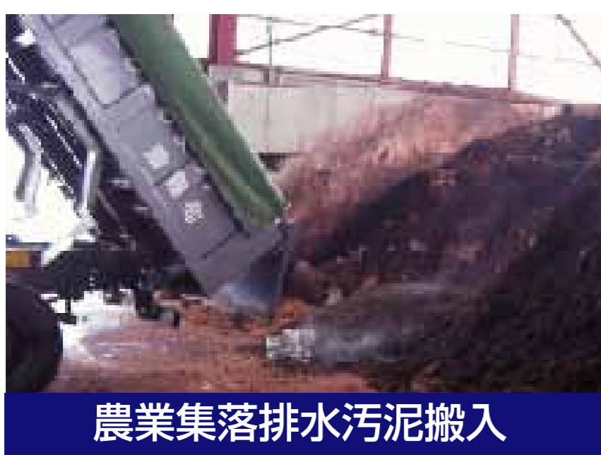
農業集落排水汚泥搬入