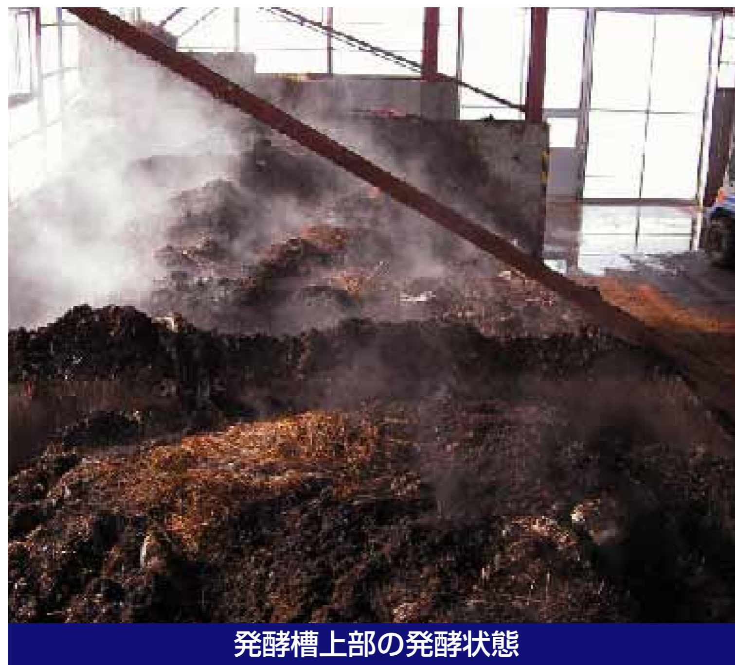
発酵槽上部の発酵状態