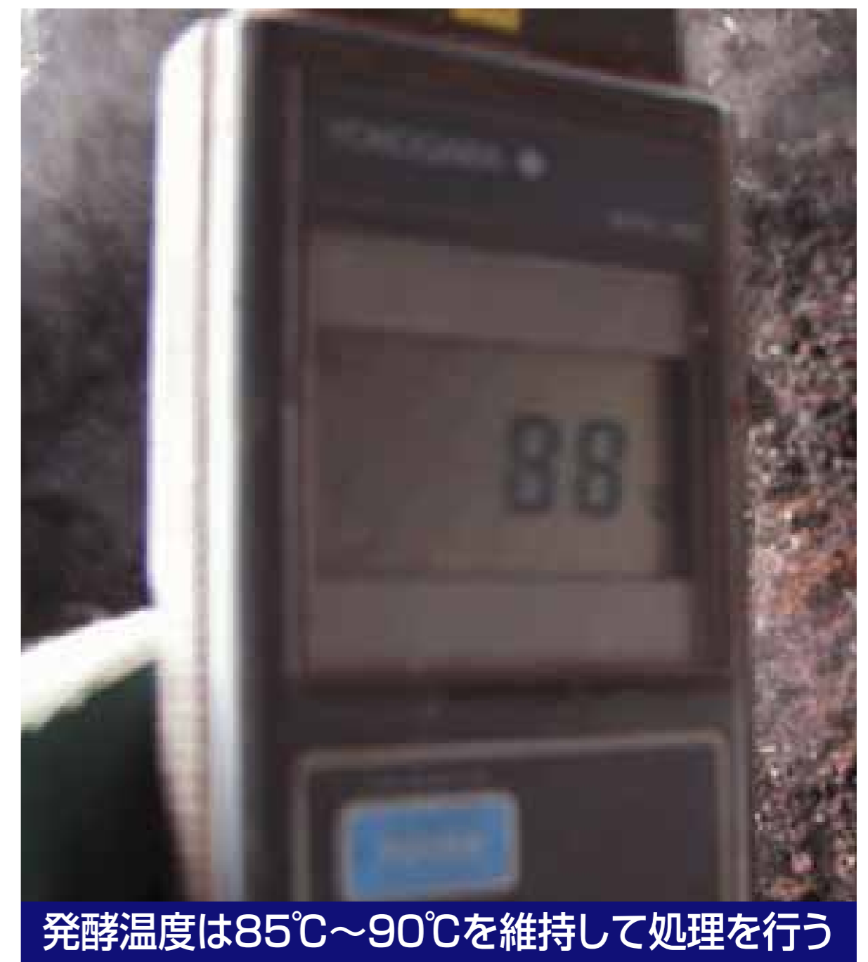
発酵温度は85℃~90℃を維持して処理を行う