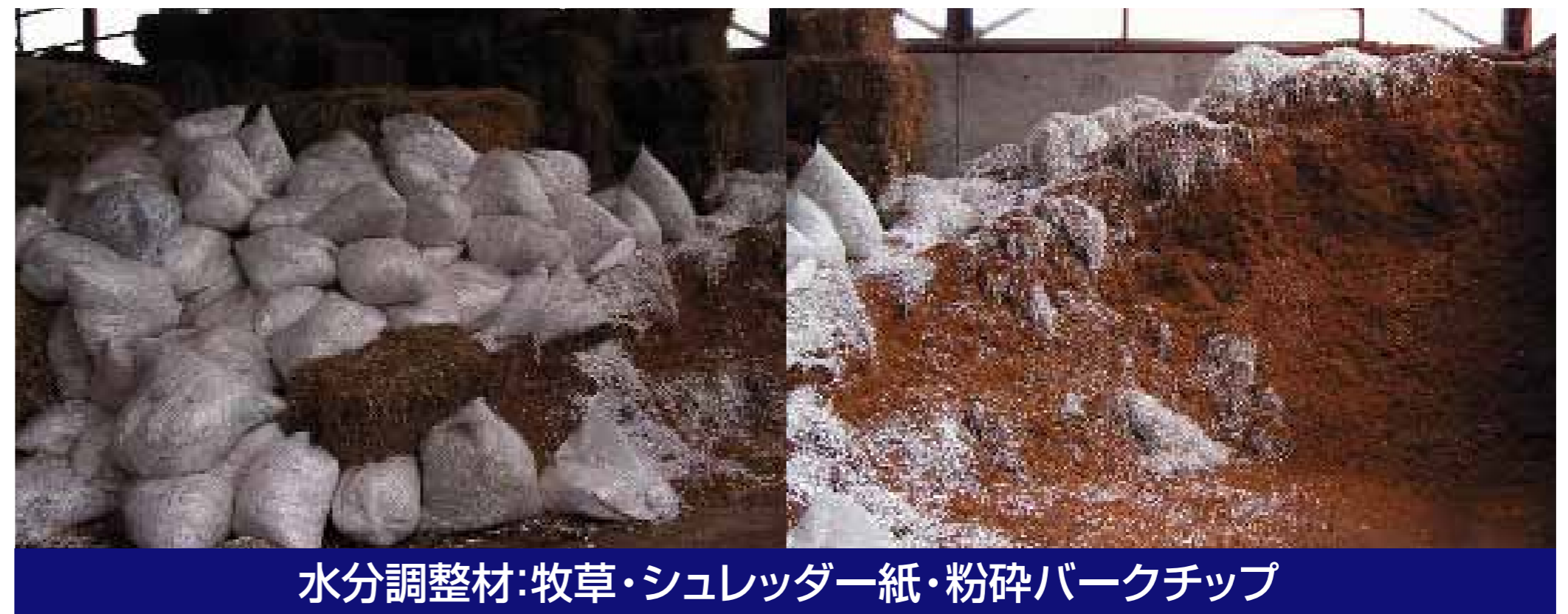
水分調整材:牧草・シュレッダー紙・粉碎バークチップ