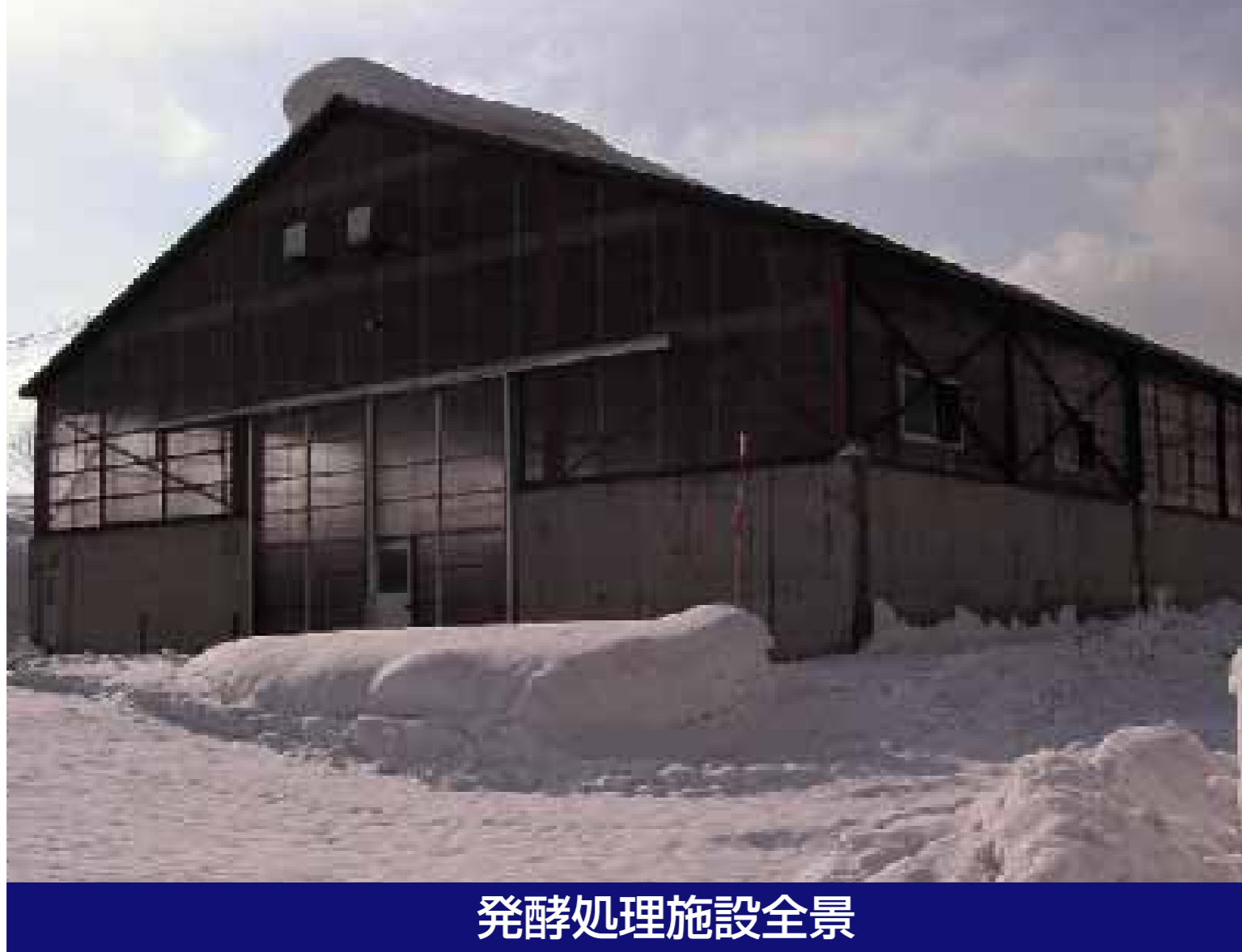
発酵処理施設全景