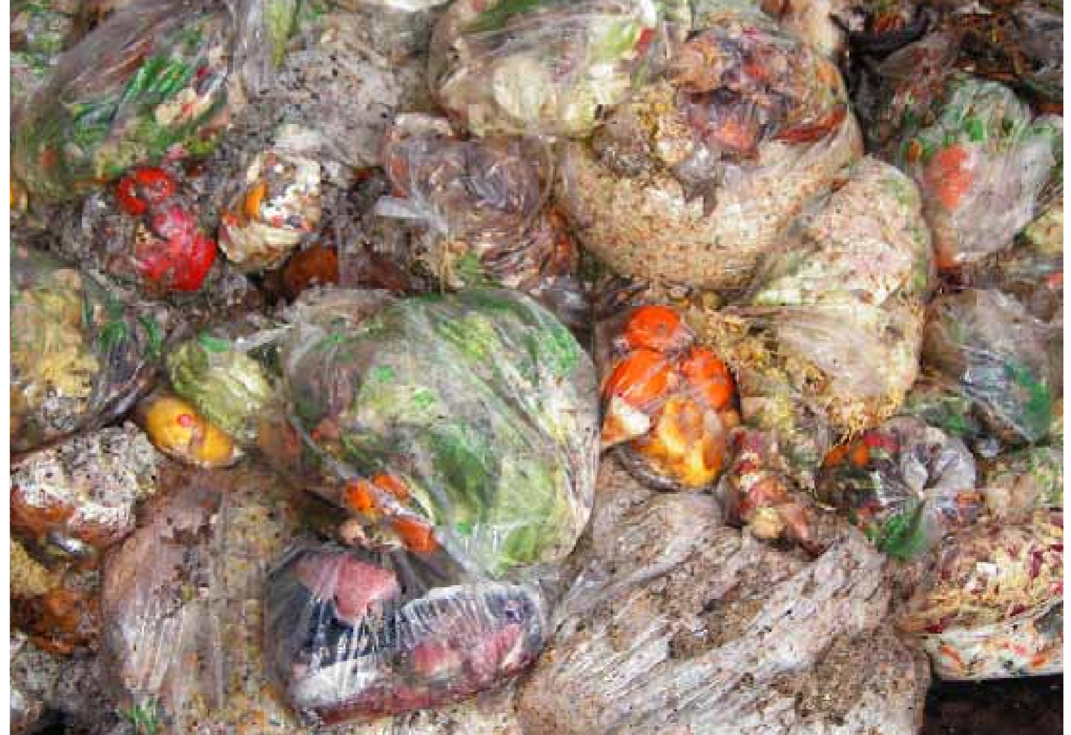
生ごみ:生分解性袋で回収しているがビニール類や異物も混ざって入ってくる