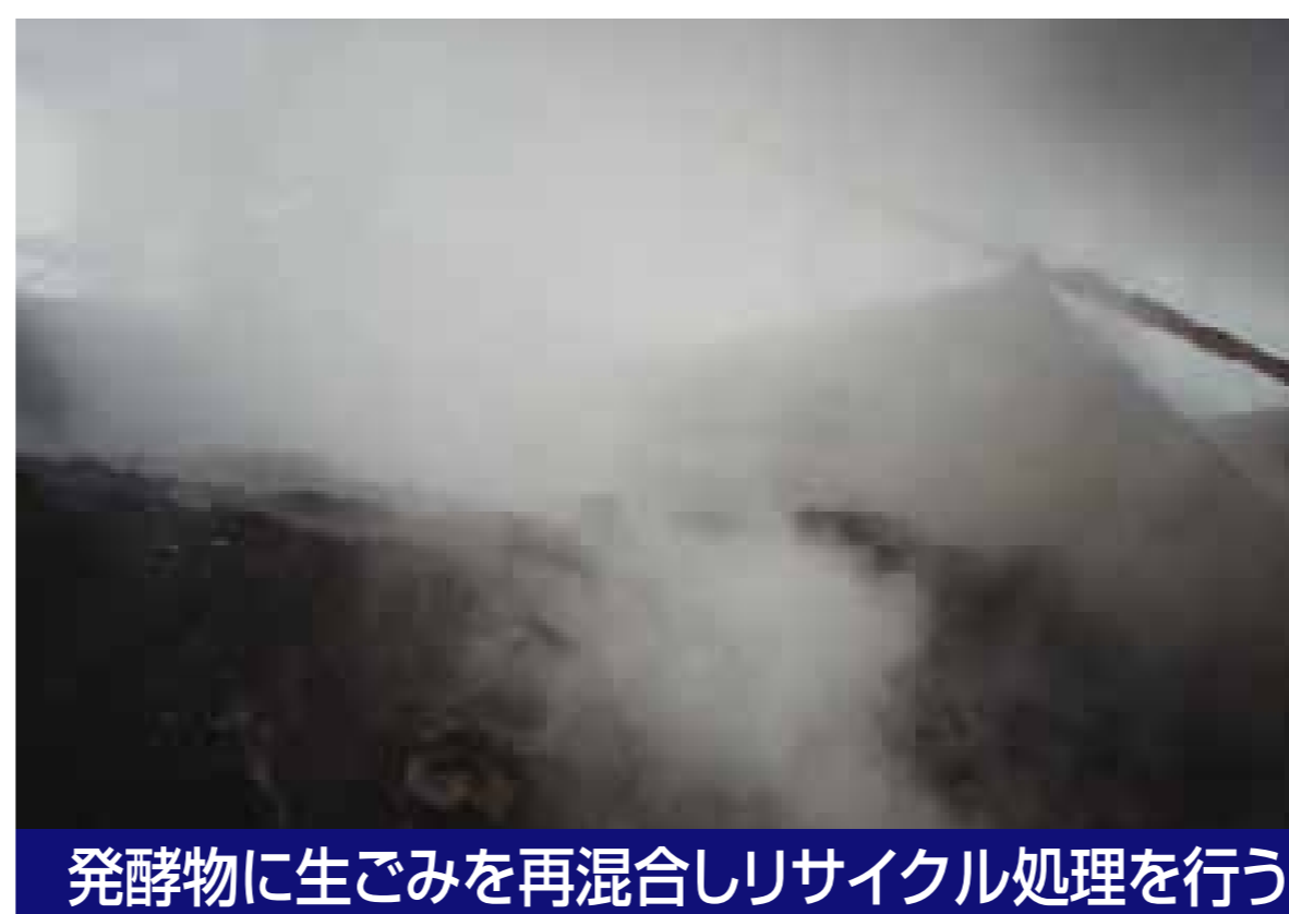
発酵物に生ごみを再混合しリサイクル処理を行う