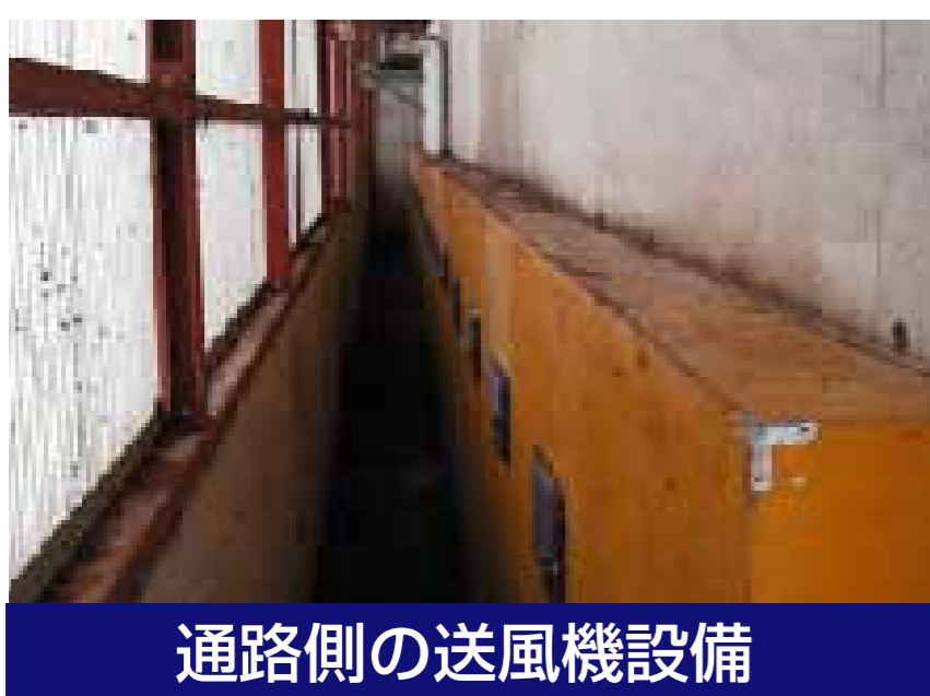
通路側の送風機設備