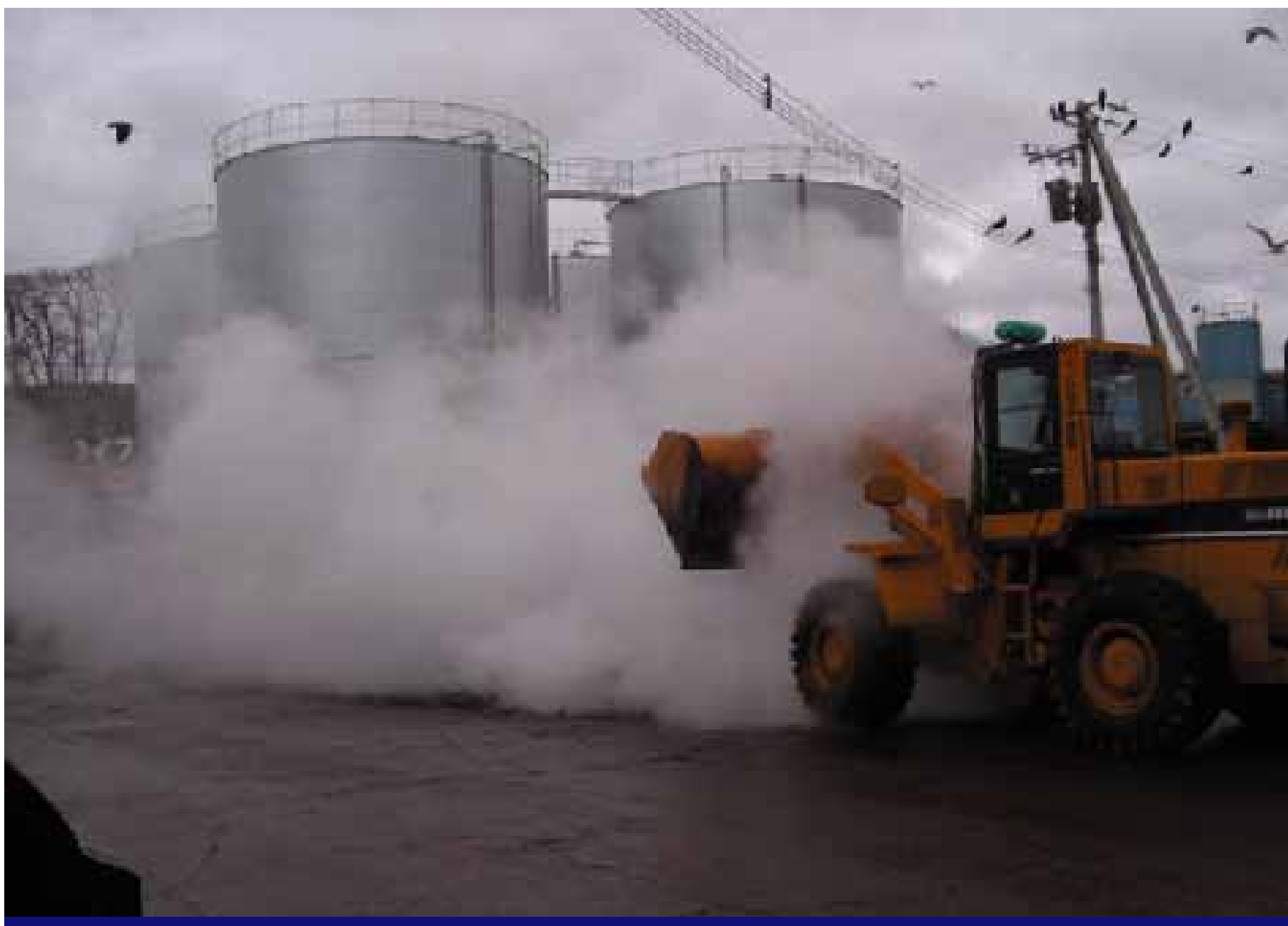
屋外で切返しを行う様子