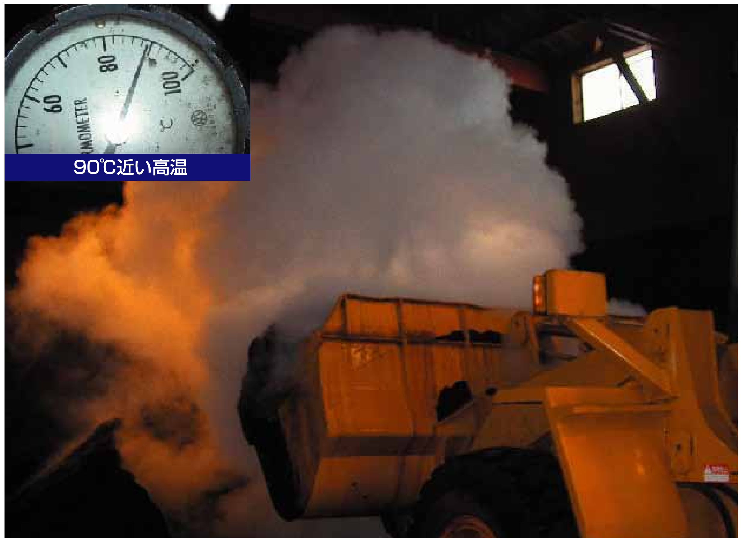
水分調整・切返し作業時の水蒸散