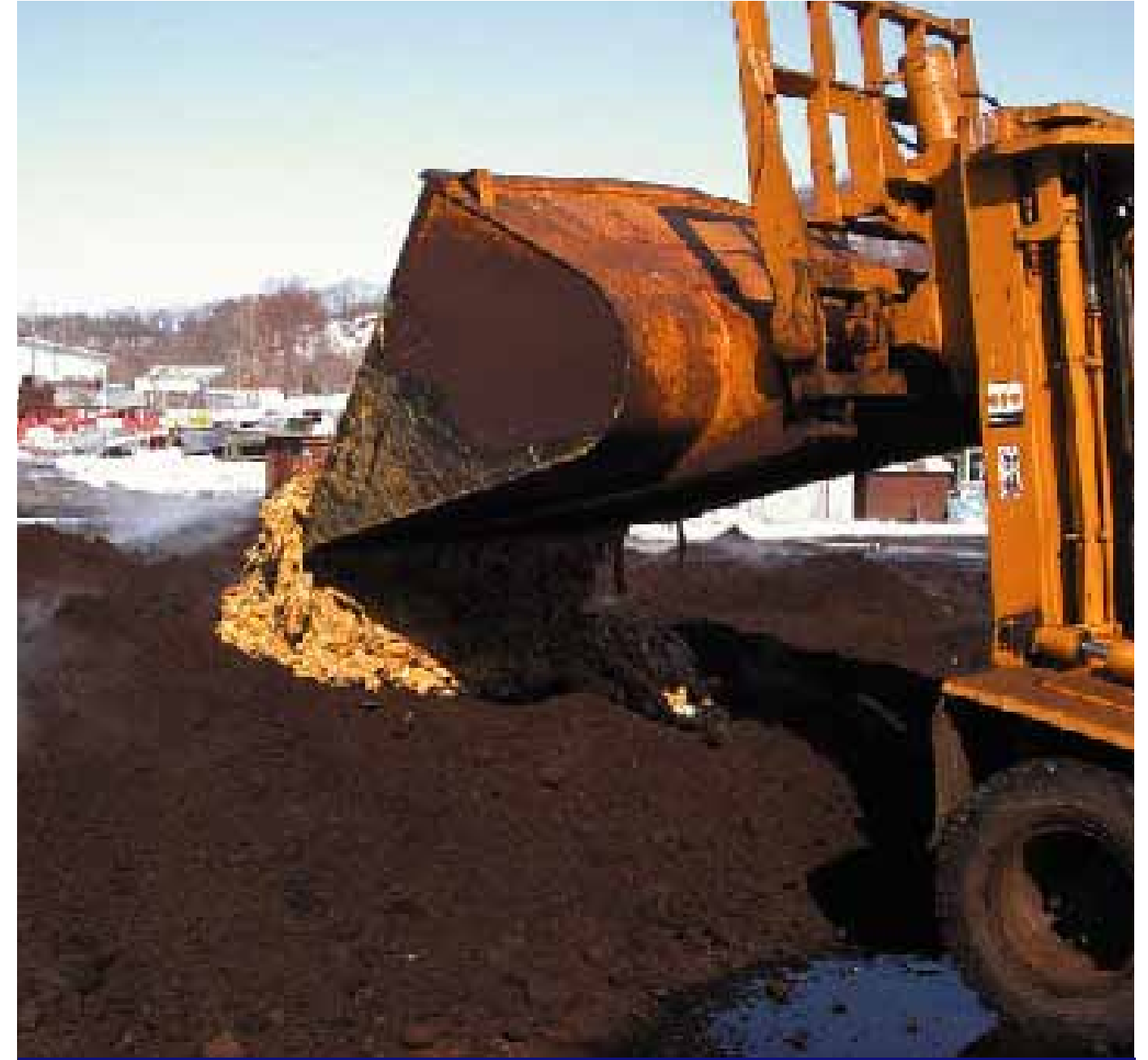
牛糞堆肥に混合して水分調整を行う