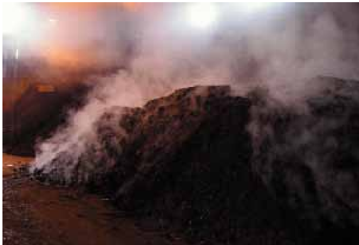
堆積作業時の水蒸気