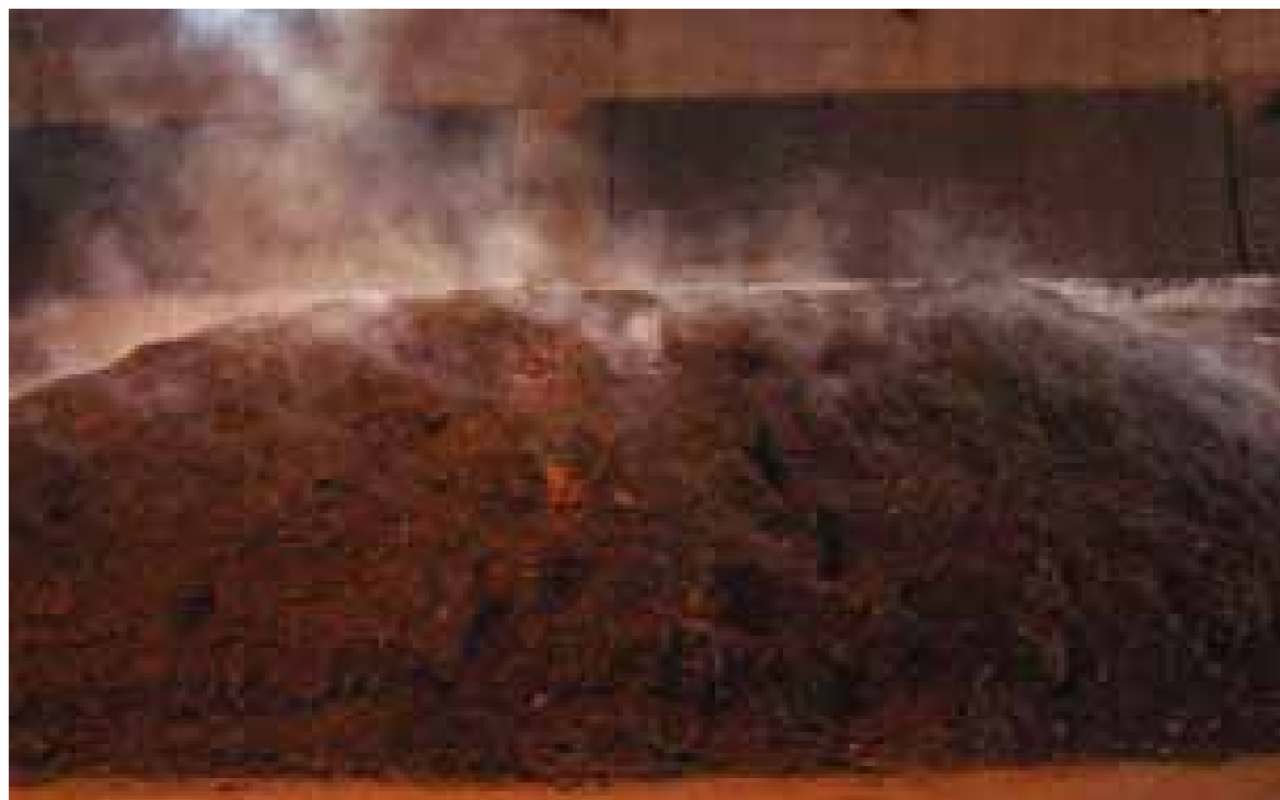
床面通気設備の発酵槽に堆積